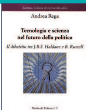
«Tecnologia e scienza nel futuro della politica» di Andrea Rega Morlacchi Editore - 13 euro

I l volume propone alcune chiavi di lettura per interpretare l'insieme dei significati legati alla querelle tra J.B.S. Haldane e B. Russell. Un dibattito poi sfociato nella pubblicazione, a quattro mani, del libro: «Dedalo o la scienza e il futuro. Icaro o il futuro della scienza». Diversi temi, all'interno dei due rispettivi saggi che animano la disputa, verranno affrontati, con forza premonitrice, dai due pensatori che nel contrapporsi di prospettive ottimiste e pessimiste, raccoglieranno la sfida di esplicitare le relazioni che intercorrono tra tecnologia, scienza e politica. Nell'insieme delle due differenti posizioni, non riducibili in un'unica sintesi, emerge un tentativo capace di rilevare l'aspetto ancipite della tecnologia come applicazione dei successi della scienza. Una problematicità destinata a ravvivare l'interesse filosofico proteso a identificare limiti e opportunità sottesi all'enorme protesi tecnologica che caratterizza la vita umana, tanto da rendere possibili inaudite forme di libertà e altrettante minacce di soggiogamento. ■